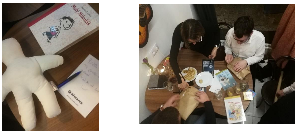
Figure 2 Photos de l'emballage des livres, poupées Kiwanis et notes personnelles écrites à la main.

Voici comment le programme a été développé (voir le programme détaillé ci-dessous) pour obtenir la meilleure expérience possible et donner envie aux participants de faire partie de Kiwanis en Slovaquie.