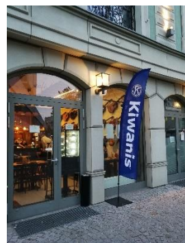
Figure 10 Oriflammes Kiwanis à l'extérieur du lieu de l'événement

Pour rendre le lieu de votre événement Kiwanis plus visible pour le public, utilisez un oriflamme et placez-le près de l'entrée. Les participants et les invités le trouveront facilement et il contribuera à la promotion de Kiwanis.